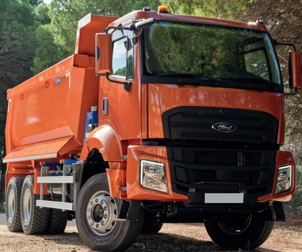
Photo non contractuelle. Equipements selon version. Dans la limite du stock disponible.